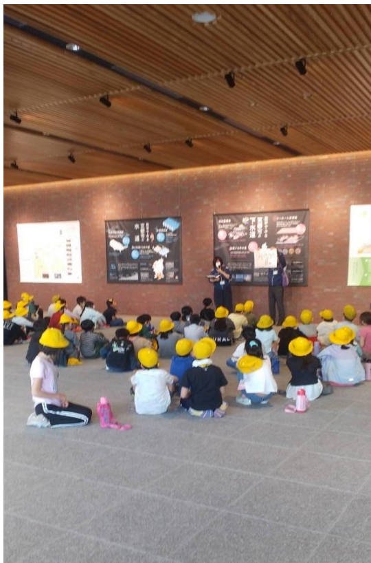
⑤ 京都市の水道の歴史を学ぶ